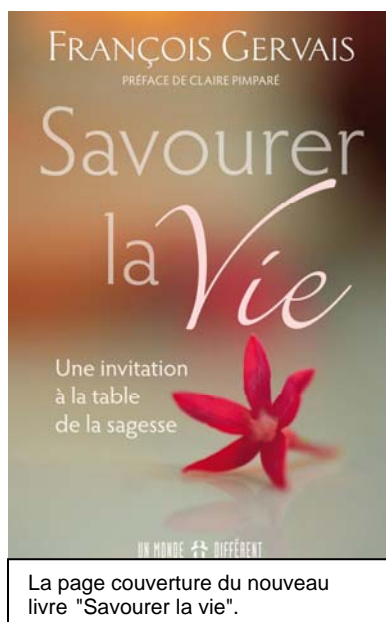
La page couverture du nouveau livre "Savourer la vie".